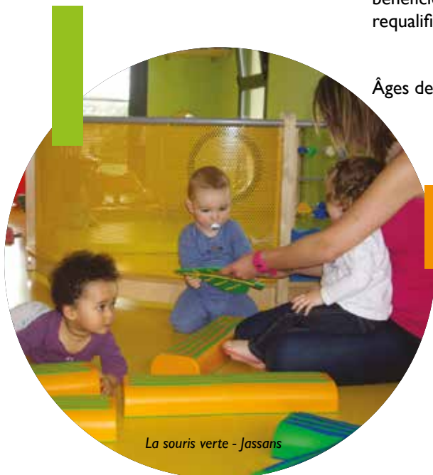
La souris verte - Jassans