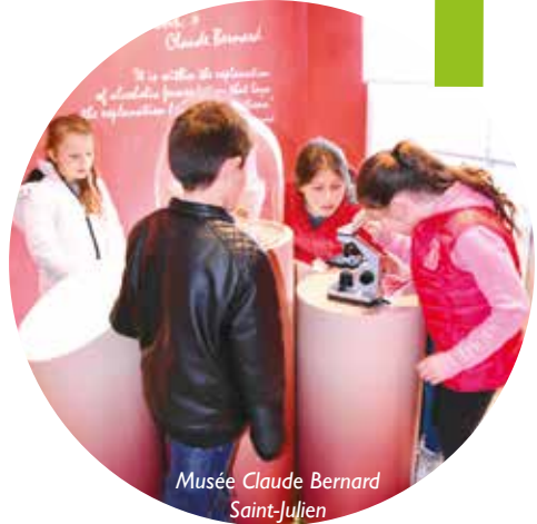
Musée Claude Bernard Saint-Julien