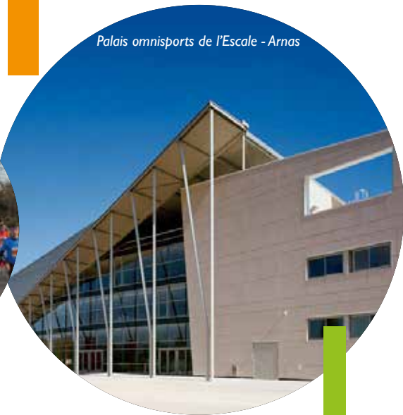
Palais omnisports de l'Escale - Arnas