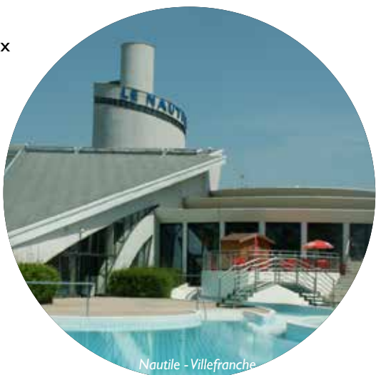
Nautile - Villefranche